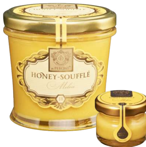
MELON 250 g / 30 g

Składniki: miód kremowy 90%, mielone pistacje 10%.