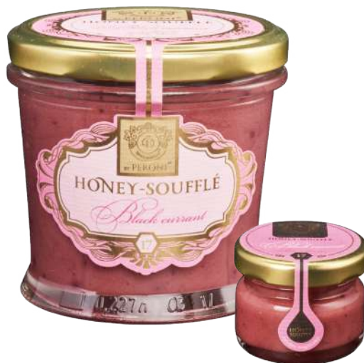
CZARNA PORZECZKA 250 g / 30 g

Składniki: miód kremowy 90%, suszona morela 10%.