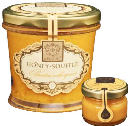
MORELA 250 g / 30 g

Składniki: miód kremowy 90%, suszona morela 10%.