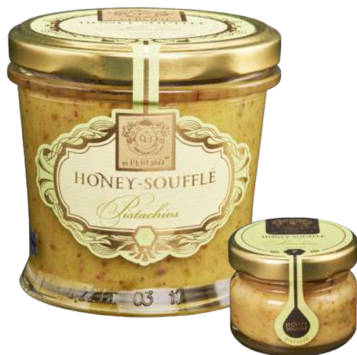
PISTACJE 250 g / 30 g

Składniki: miód kremowy 90%, mielone pistacje 10%.