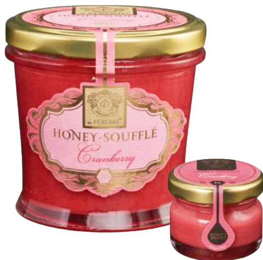
ŻURAWINA 250 g / 30 g