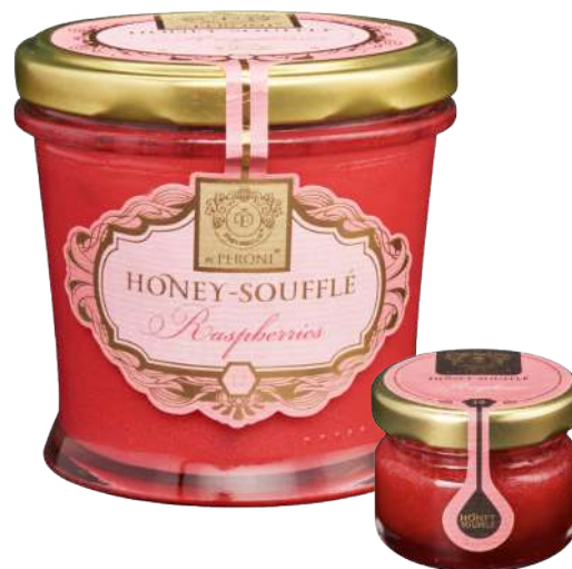
MALINA 250 g / 30 g